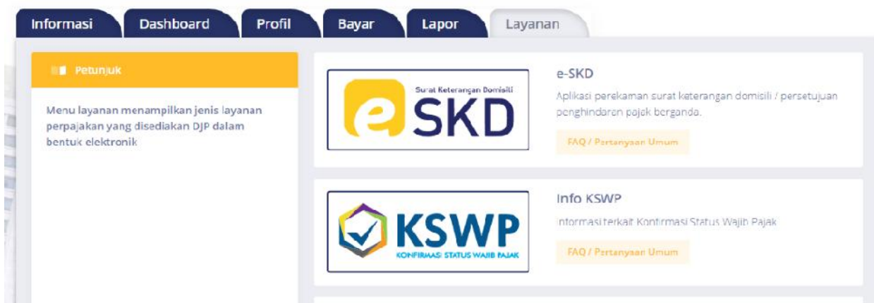
Gambar 2: Info KSWP pada menu Layanan